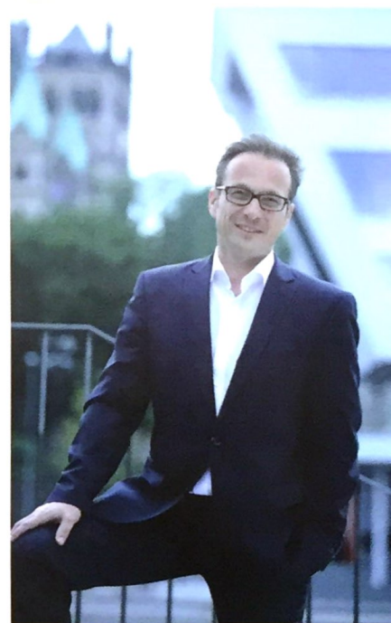
Reiner Breuer Bürgermeister

Stadt Neuss Der Bürgermeister Presse- und Informationsamt Markt 2 Telefon 02131 90-4300 Telefax 02131 90-2480 Presseamt@stadt.neuss.de